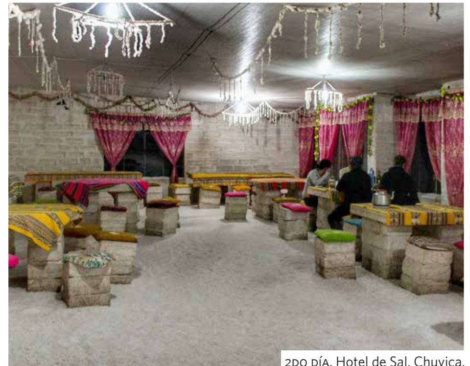
2DO DÍA. Hotel de Sal, Chuvica.