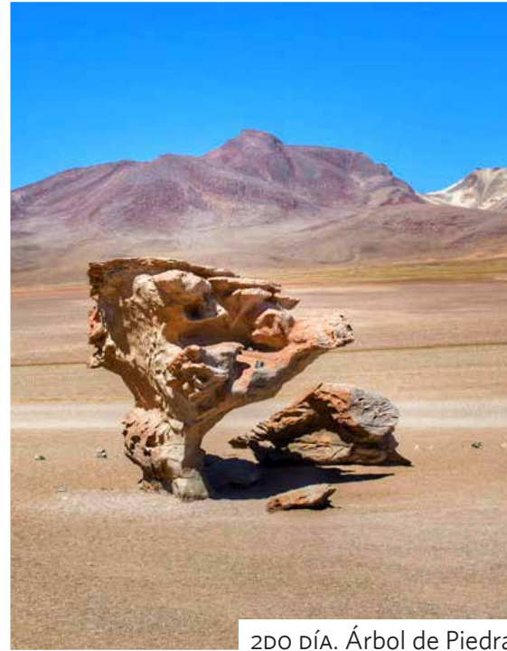
2DO DÍA. Árbol de Piedra.