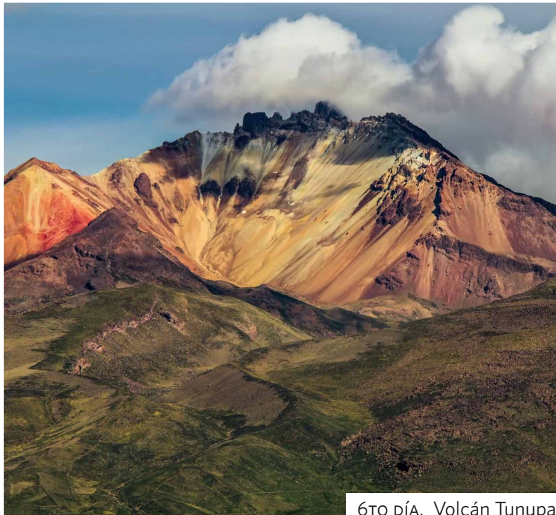
6TO DÍA. Volcán Tunupa.