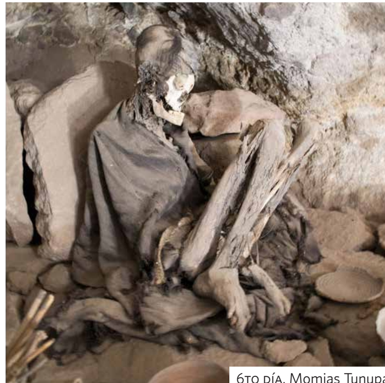
6TO DÍA. Momias Tunupa.