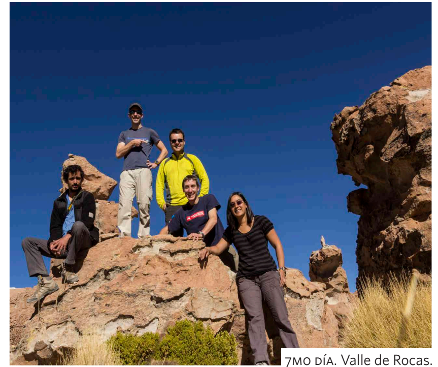
7MO DÍA. Valle de Rocas.