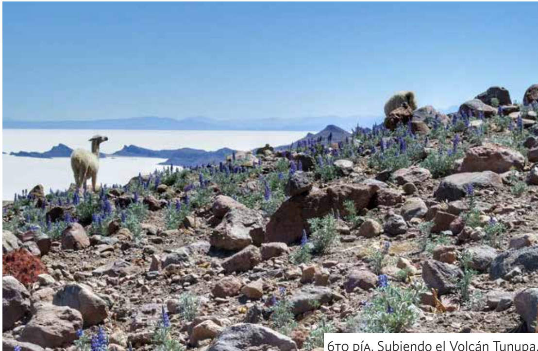
6TO DÍA. Subiendo el Volcán Tunupa.